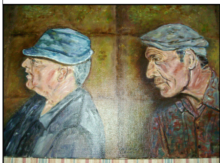
Tableau réalisé par Mme Joly

Nous voici, soudain, projetés, près de 25 ans en arrière, en ce jour d'été où nous avons fait la connaissance du meunier du Mazel et de son compagnon.