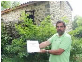
Le président présente la maquette du livre lors d'une rencontre du C.A. en juillet

Le tout illustré de belles photos... un livre à s'offrir et à offrir... c'est aussi un moyen de soutenir l'association tout en se faisant plaisir. Pensez à consulter le site dans lequel nous mettrons les informations au fur et à mesure. Et voir page 5