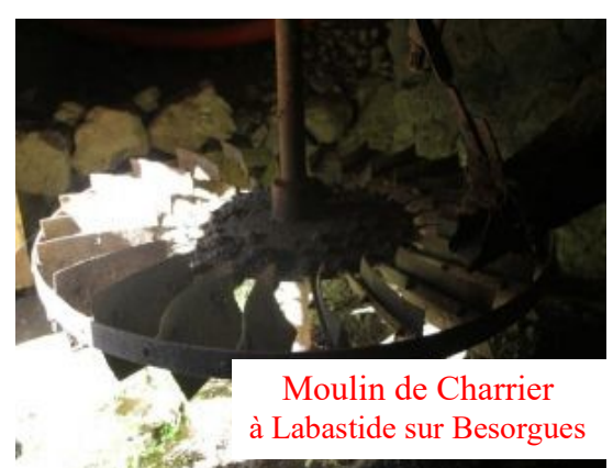
Moulin de Charrier à Labastide sur Besorgues