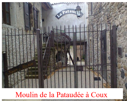
Moulin de la Pataudée à Coux