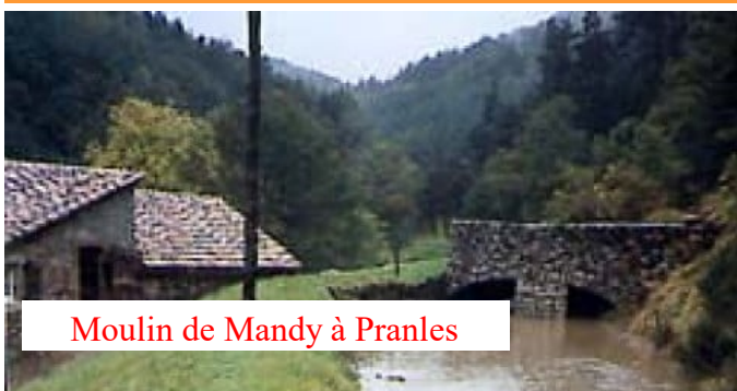
Moulin de Mandy à Pranles