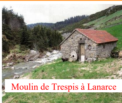
Moulin de Trespis à Lanarce

le numéro de Mai 2018 du magazine ardéchois Ma Bastide consacre un grand article à ce moulin de Trespis