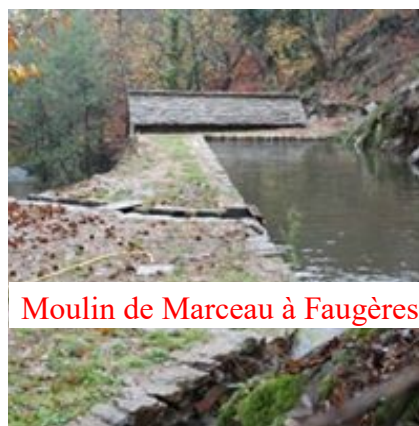
Moulin de Marceau à Faugères